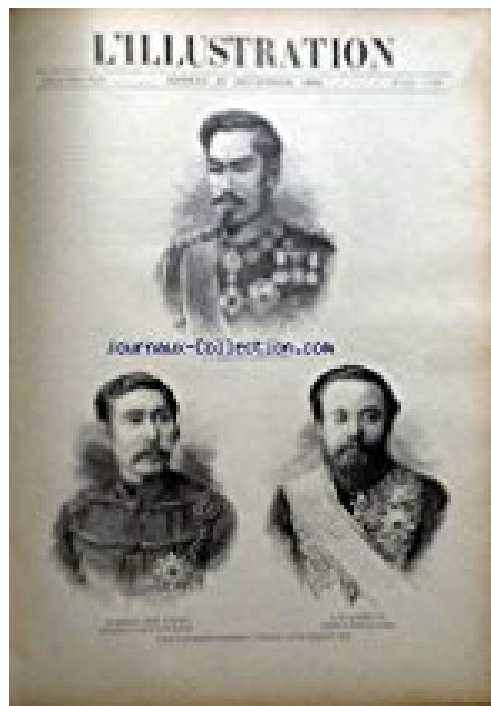
ILLUSTRATION (L') [No 2692] du 29/09/1894 - S.M. MUTSU HITO EMPEREUR DU JAPON - S.EXC. LE COMTE ITO - LE MARECHAL COMTE TAMAGATA / MM. OPPENELMER FRERES